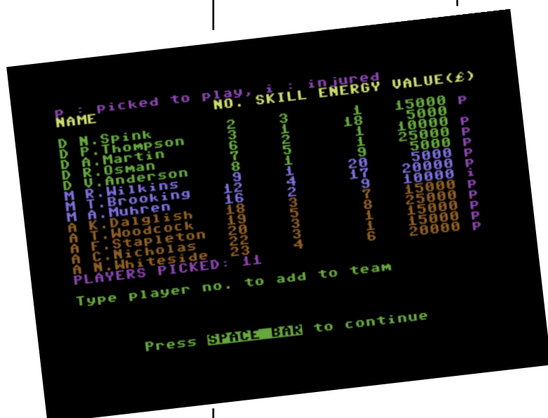
La schermata di selezione della formazione

Questo Football Manager è una simulazione che non necessita di pratica per entrare subito nel vivo del gioco e trasmette emozioni tali, nonostante la pessima grafica e il sonoro appena accennato, da non riuscire a smettere di giocare. Capiterà frequentemente di incitare i propri calciatori, gioire o inveire nei confronti del proprio attaccante, quando davanti alla porta tira addosso al portiere avversario, sbagliando un goal già fatto. Sono passati ormai 18 anni dalla sua pubblicazione, ogni tanto, qualche partita la faccio ancora senza annoiarmi. Una longevità così elevata credo sia unica nella storia del glorioso C64. Football Manager deve far parte della collezione di giochi per C64 di tutti gli amanti di questo sport.